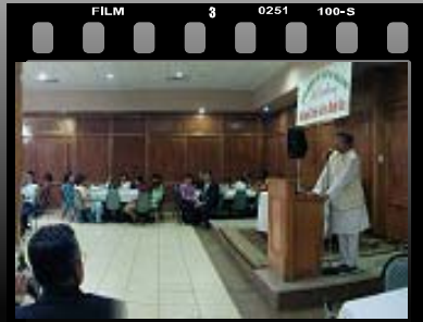
RFQ Award Today