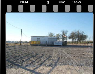
Ground Breaking Ceremony